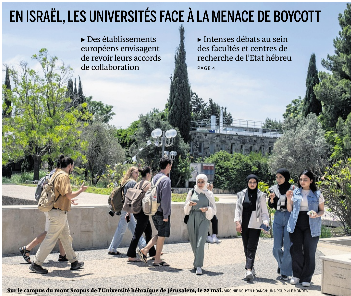
Sur le campus du mont Scopus de l'Université hébraïque de Jérusalem, le 22 mai.